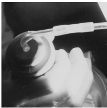
Imatges: Físic que estudia els raigs alfa en una cambra de boira, setembre 1957.