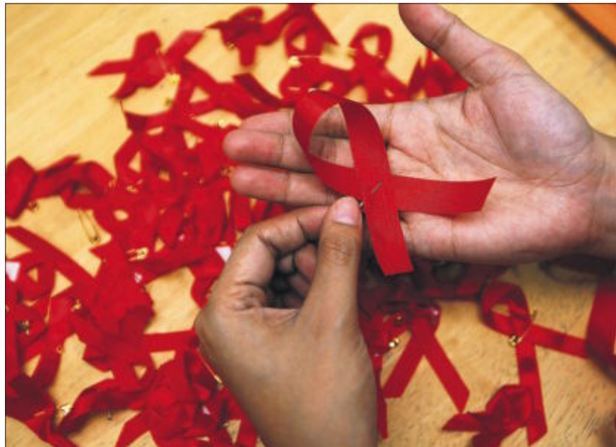
El linfogranuloma puede causar úlceras genitales, vómitos y diarreas.

des de transmisión sexual están al alza en todo el continente”, avisa. “La incidencia por ahora es menor, pero debemos mantenernos alerta y vigilar la evolución del brote”, añade un portavoz de la ASPB.