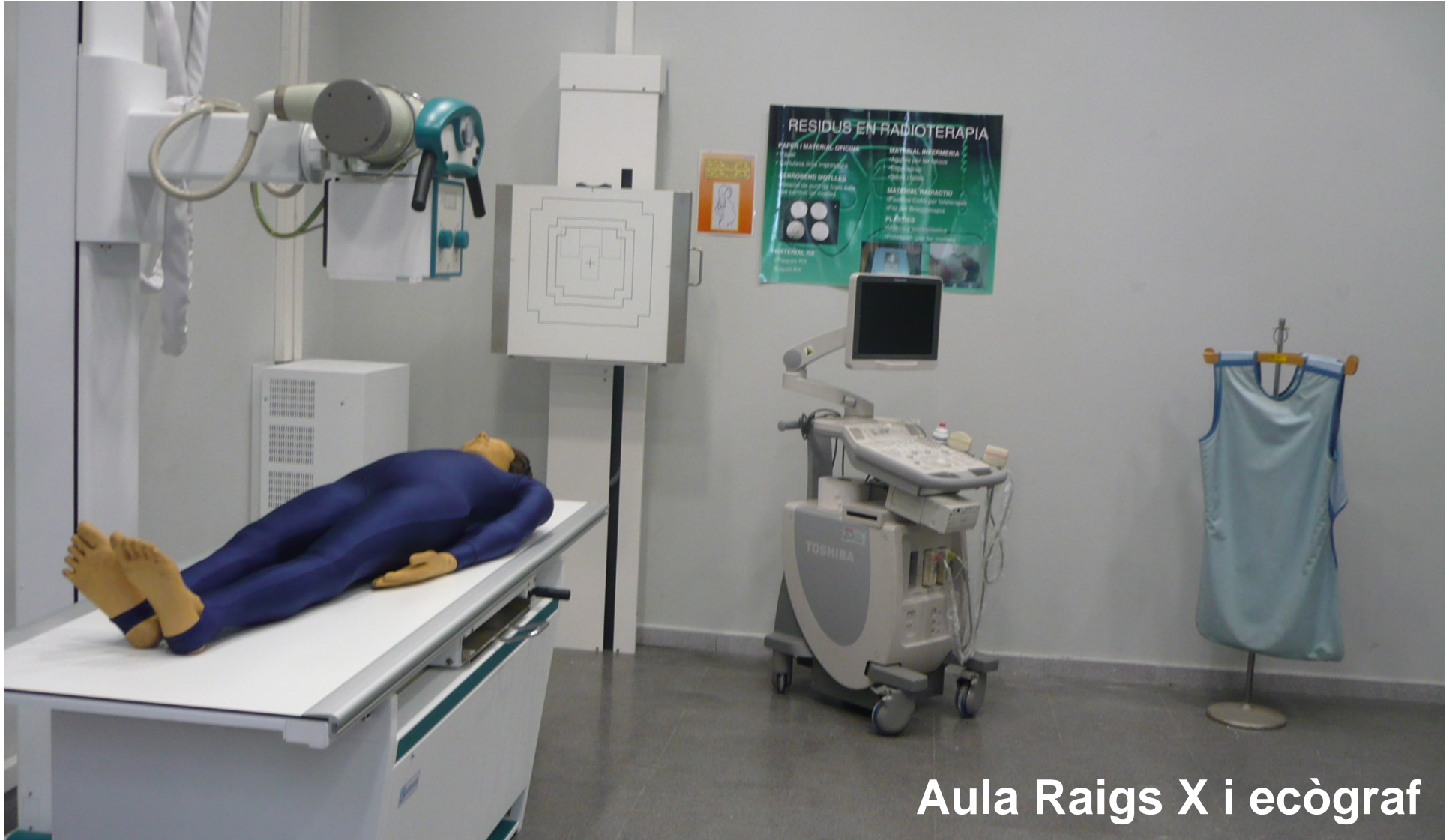
Aula Raigs X i ecògraf