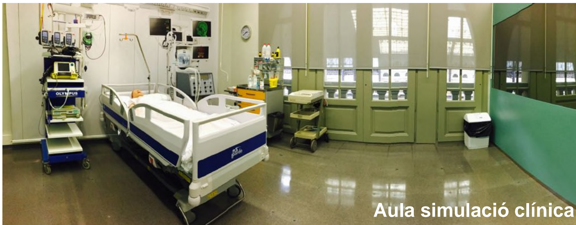
Aula simulació clínica