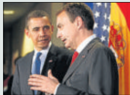
Zapatero, con Obama