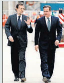
Mariano Rajoy, con Cameron

Los presidentes de Gobierno —desde González a Rajoy, pasando por Aznar a Rodríguez Zapatero— llegaron al poder con la misma deficiencia, la falta de dominio de la lengua franca, el inglés. La causa es la misma que la de