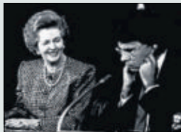
Felipe González, con Thatcher