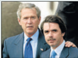
José María Aznar, con Bush