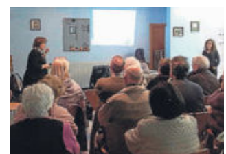
ENCUENTRO EN EL BARRIO DE LA VERNEDA ASPB

de la ciudad –como Guineueta, Raval, La Verneda-La Pau, Besòs-Maresme, Sant Pere-Santa Caterina-La Ribera, Barceloneta, Bon Pastor y Baró de Viver– con un programa de conferencias semanal.