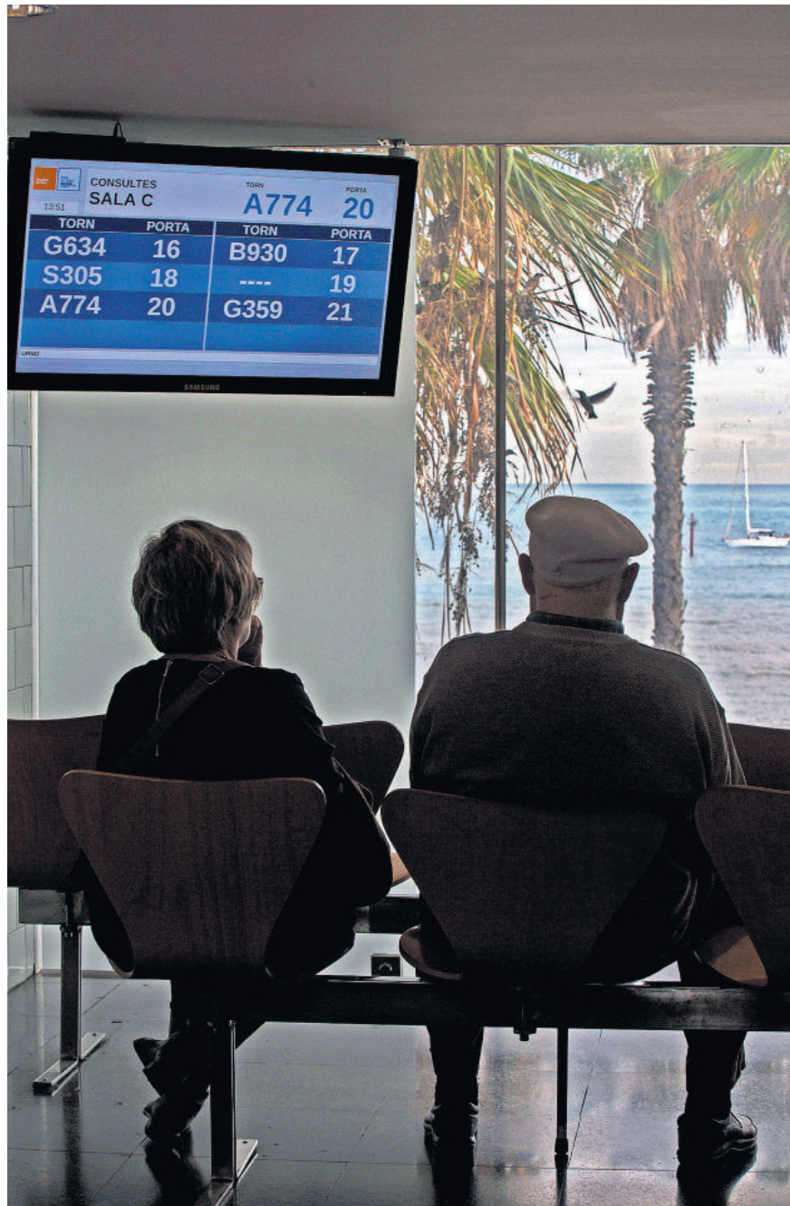
Una parella de gent gran espera torn per entrar en un dels consultoris a l'Hospital del Mar de Barcelona.